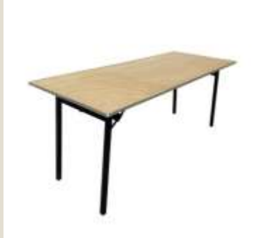
Τραπέζι Μπιανκέ, η διάσταση του είναι 180*70.