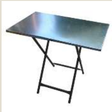
Μεταλλικό τραπέζι, πτυσσόμενο η διάσταση του είναι 50*80