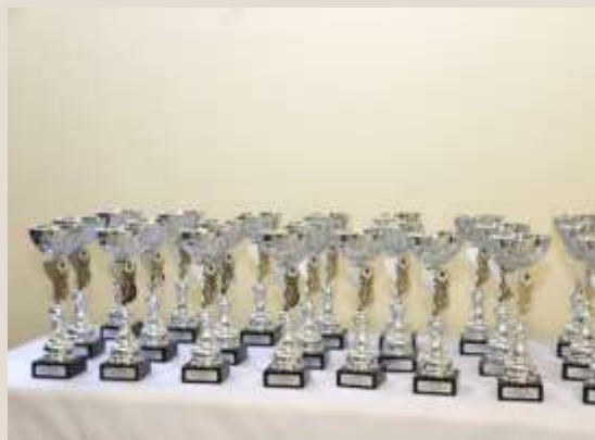
Κύπελλα για το ατομικό μαθητικό