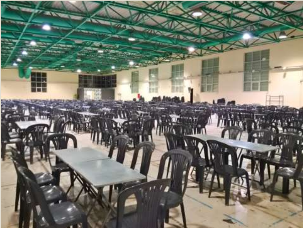
Χώρος αναμονής για τους συνοδούς.