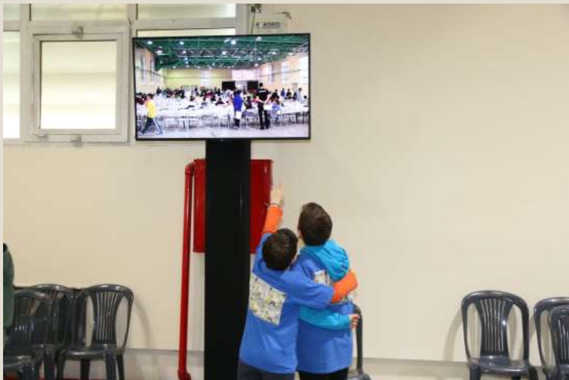
Στο χώρο των συνοδών υπάρχουν οθόνες που δείχνουν πλάνα μέσα από την αίθουσα αγώνων