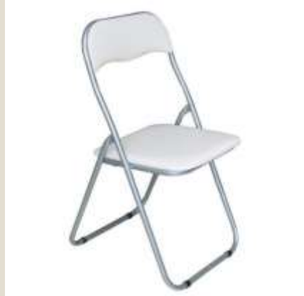
Καρέκλα Sabrina, πτυσσόμενη από μεταλλικό σκελετό