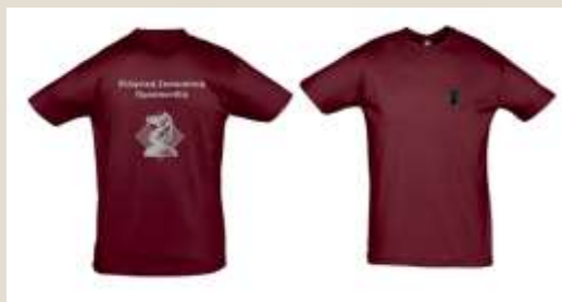
Μπλούζες για το επιτελείο