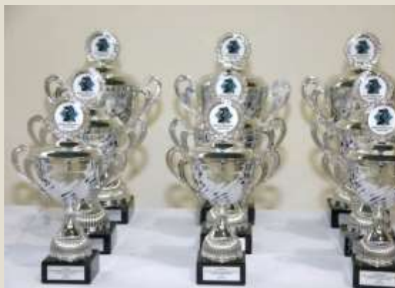
Κύπελλα για το ομαδικό μαθητικό