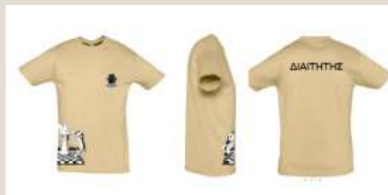
Μπλούζες για τους διαιτητές