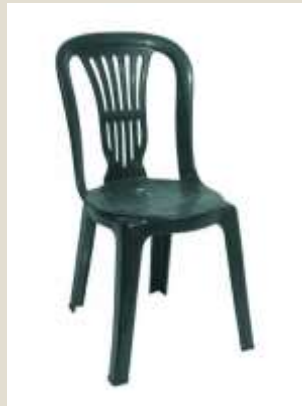
Καρέκλα Βιέννης, πλαστική.